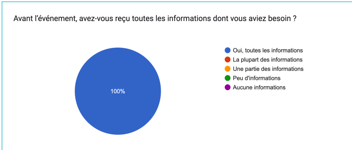
Graphique 1. Retours des exposants concernant l'accompagnement et l'information en amont de la première édition du NormHandi'Joy.

Parallèlement, le choix du lieu, en parfaite adéquation avec les valeurs et les thématiques de l'événement, a renforcé cette impression de cohérence et de professionnalisme.