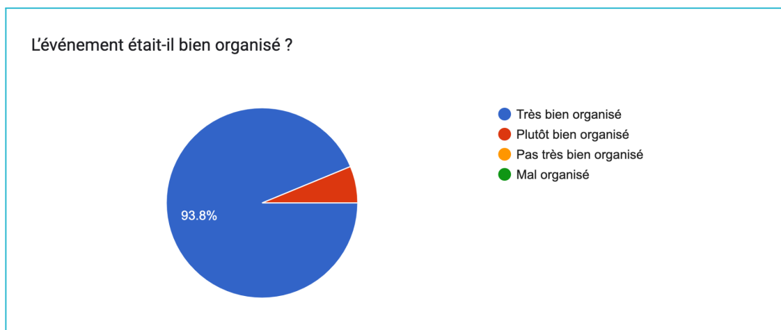
Graphique 2. Retours des exposants concernant l'organisation générale de la première édition du NormHandi'Joy.

Cependant, certains exposants ont souligné que les stands installés à l'extérieur manquaient parfois de visibilité. Ce point d'amélioration a été identifié comme une piste de travail prioritaire pour optimiser l'expérience des visiteurs et des partenaires lors des prochaines éditions.